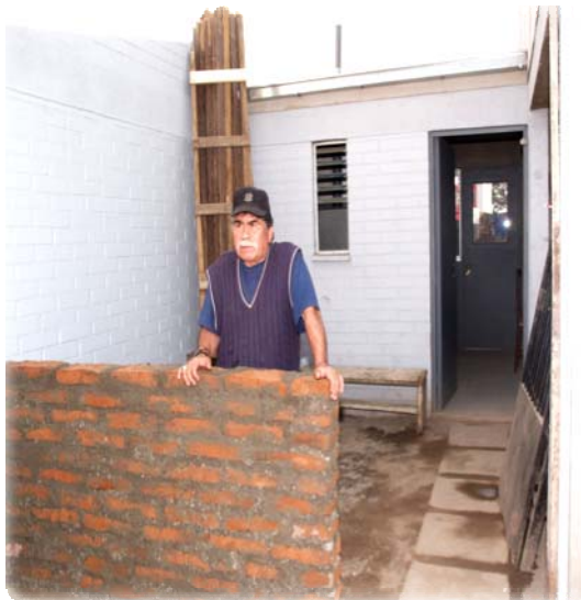
Ampliación vivienda, Santiago