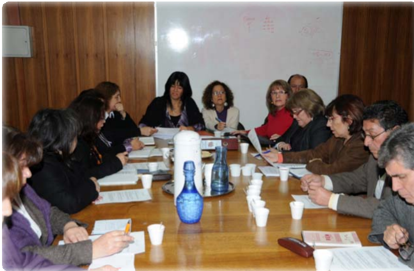
Mesas de trabajo bipartitas

Aseguramos una gestión de calidad en nuestras inversiones y al interior de la organización.