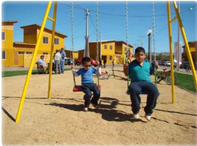
Población Juan Pablo II Palmilla