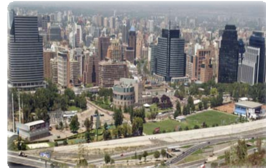
Sector oriente de Santiago