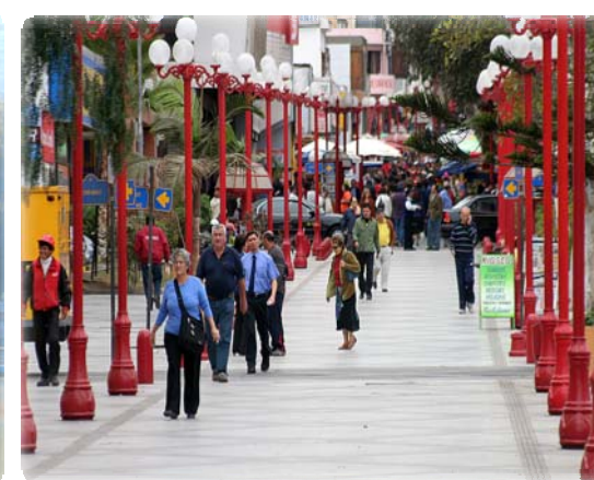
Paseo Peatonal Arica