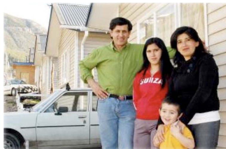
Población Ampliación Pablo Neruda, Coyhaique

Obtuvieron subsidio para adquirir o construir su vivienda