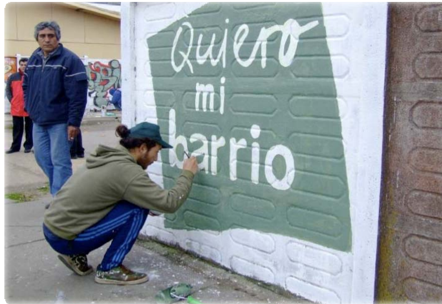
Barrio Central, Coronel

200 barrios en 80 comunas de las 15 regiones transforman su entorno, fortaleciendo su organización e iniciativas comunes.