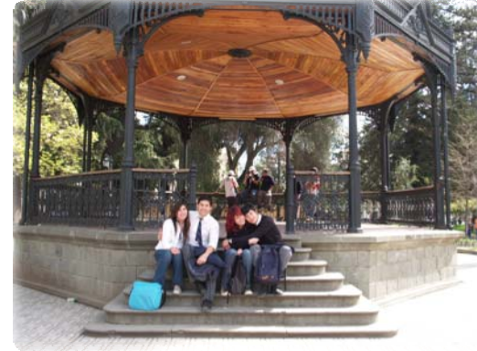
Plaza de Talca