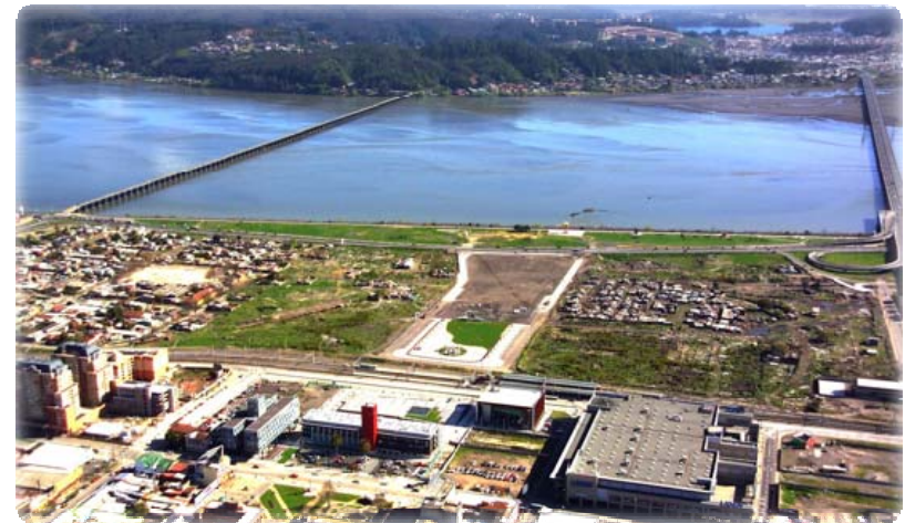
Ribera norte de Concepción

Impulsamos proyectos urbanos integrales que mejoran la calidad de vida y favorecen la integración social.