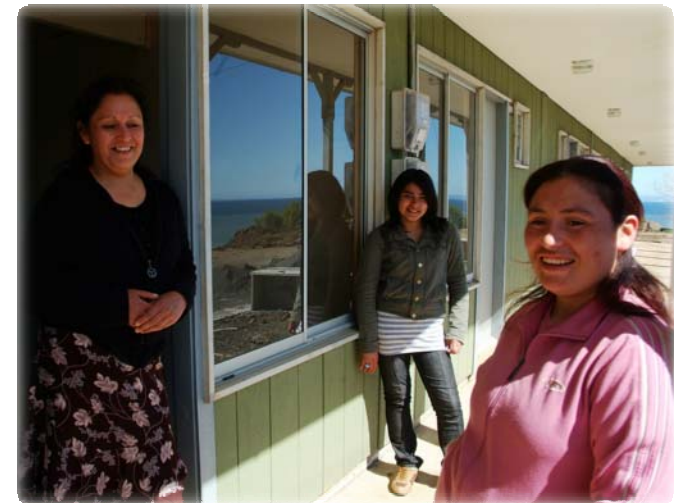
Población Los Olivos Lota, BioBío