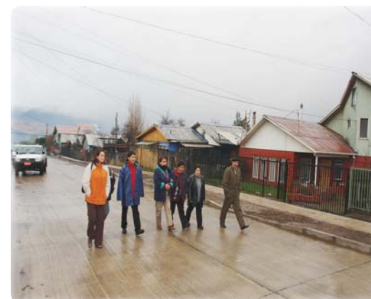
Pavimentos en Lautaro