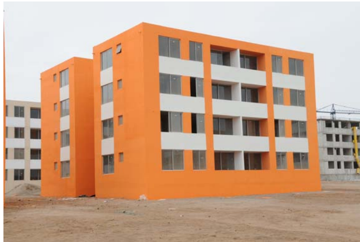
Inauguración barrio El Mirador de Arica.