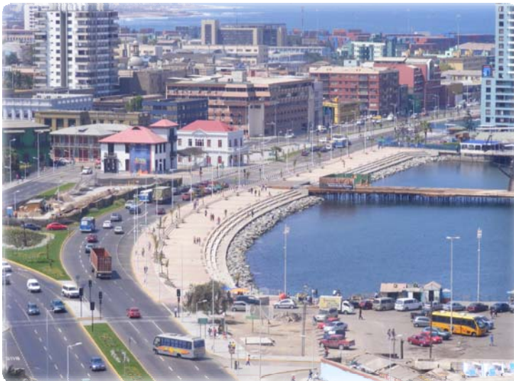
Costanera de Antofagasta