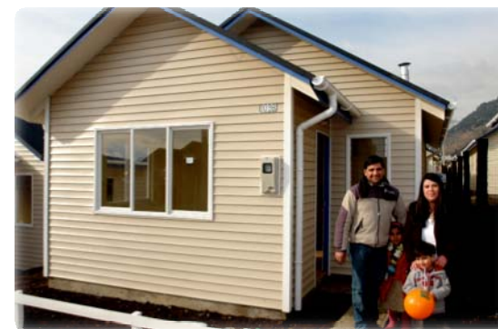
Población Ampliación Pablo Neruda, Coyhaique