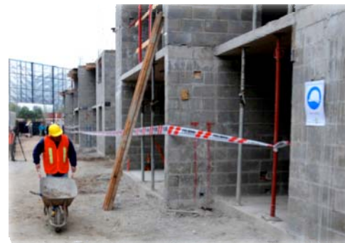
Impulso a construcción de viviendas

Generamos 100.000 empleos adicionales en 2009.