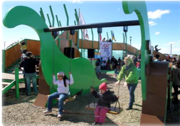
Plaza Los Niños Punta Arenas