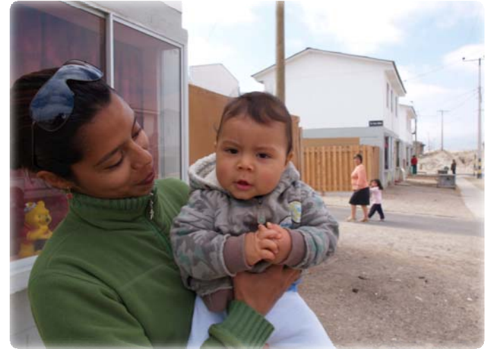
Población Las Dunas Atacama