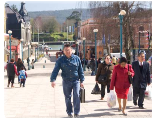
Paseo Peatonal, Valdivia