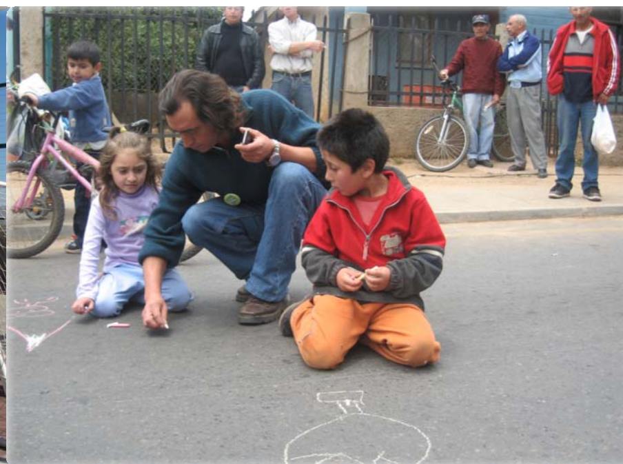
Población Santa Adriana