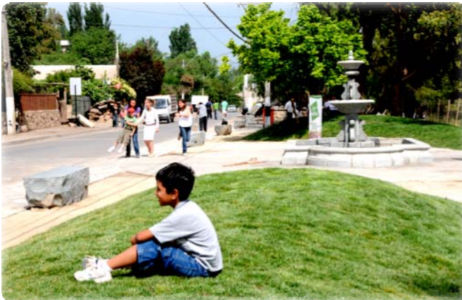
Plaza Los Canteros Colina

Rehabilitamos plazas y paseos: Más de 70 espacios públicos para el encuentro de los ciudadanos.