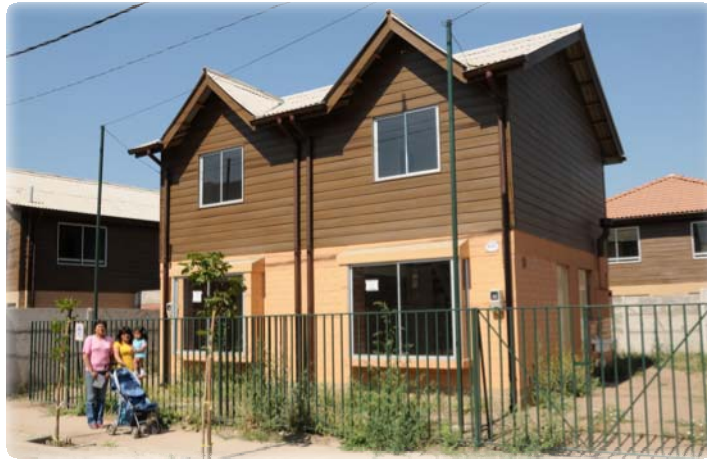
San Alberto de Casas Viejas, Puente Alto

Elevamos los estándares de calidad y superficie: