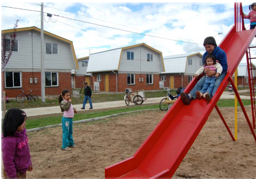
Población Brisas del Ñuble, Chillán