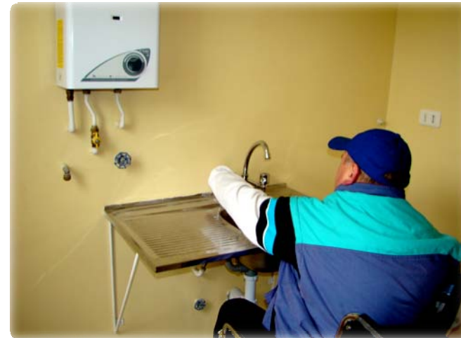
Población Cristo del Maipo San Antonio