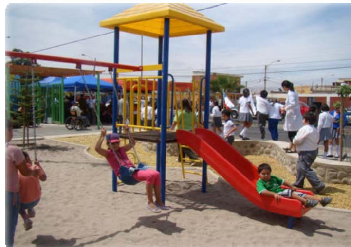
Pza San José de Arica, Quiero mi Barrio