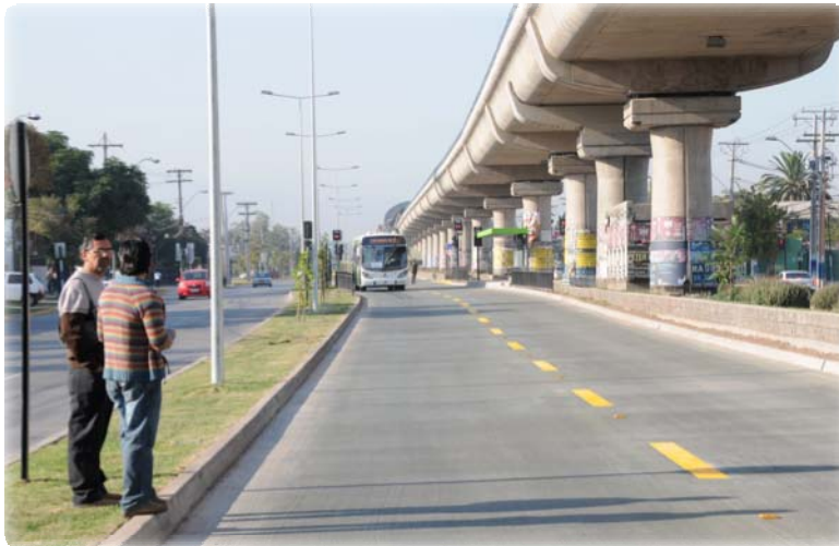
Corredor Vicuña Mackenna Reg. Metropolitana

Priorizamos la inversión en obras que mejoran la conectividad de ciudades grandes e intermedias.