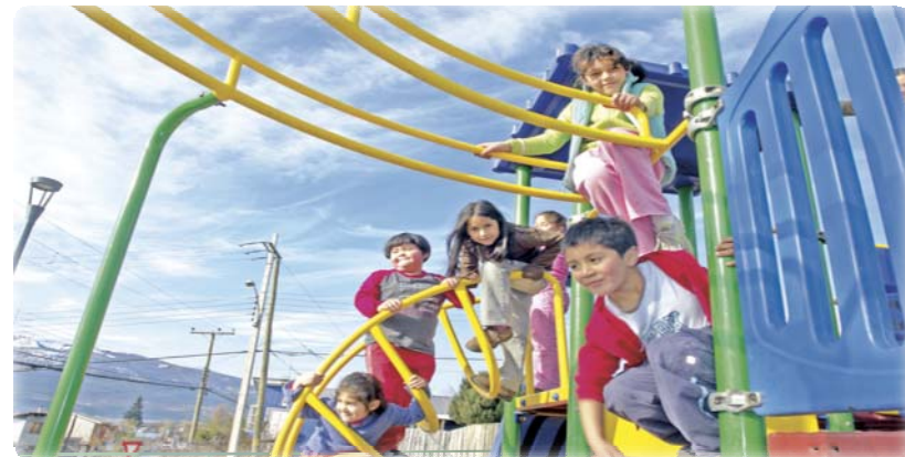
Plazoleta O'Higgins Aysén