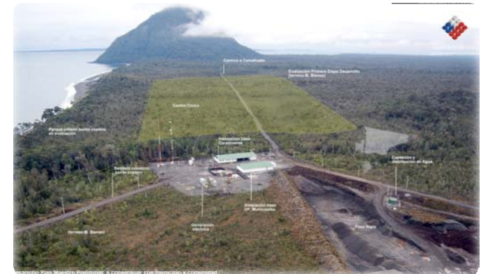
Nueva localización para Chaitén