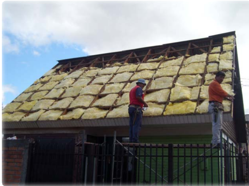
Aislación térmica en Temuco