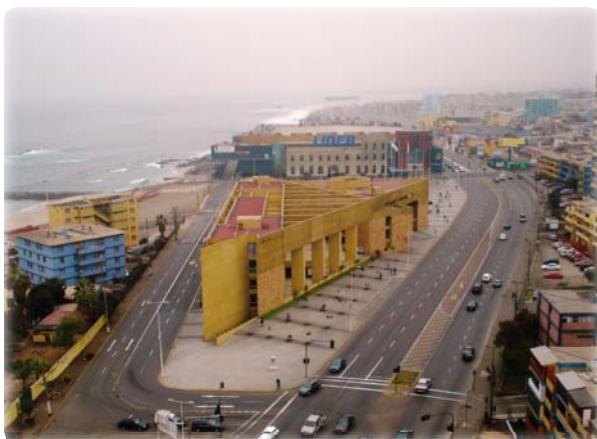
Costanera Central Antofagasta