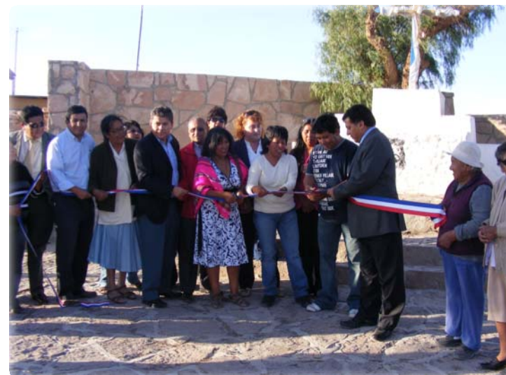
Plaza ceremonial en Chiu Chiu