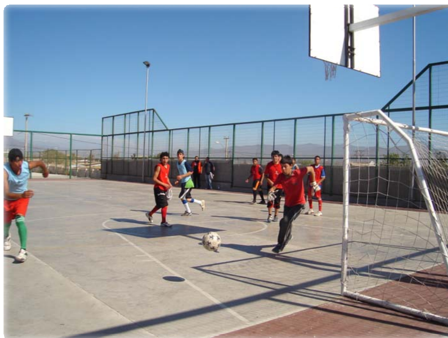
Barrio El Olivar de La Serena