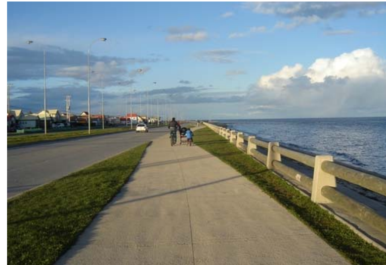
Costanera del Estrecho, Reg. Magallanes