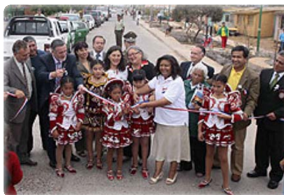
Barrio 18 septiembre, La Serena