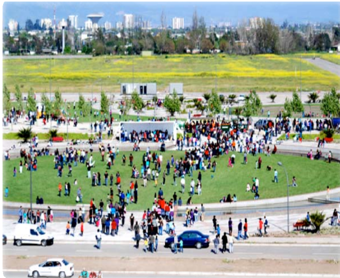
Ciudad Parque Bicentenario, Cerrillos

Impulsamos proyectos urbanos integrales que mejoran la calidad de vida y favorecen la integración social.