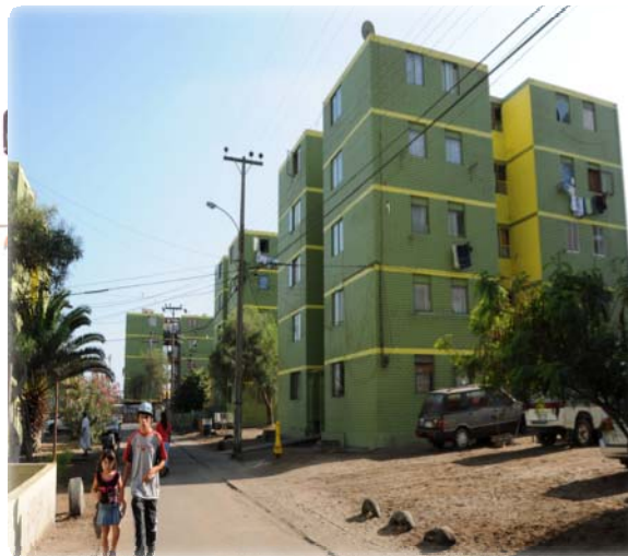
Condominio Las Quintas Iquique