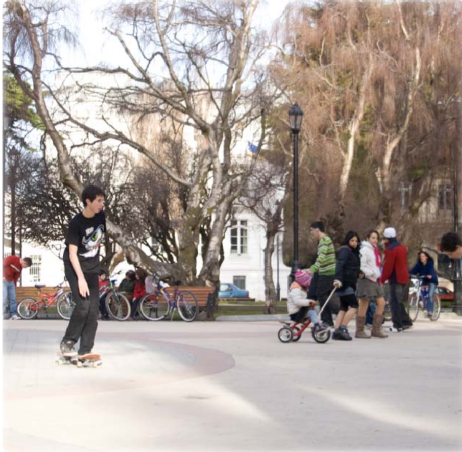
Plaza Punta Arenas