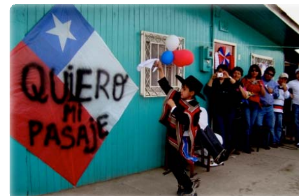
Barrio Irene Frei, O'Higgins