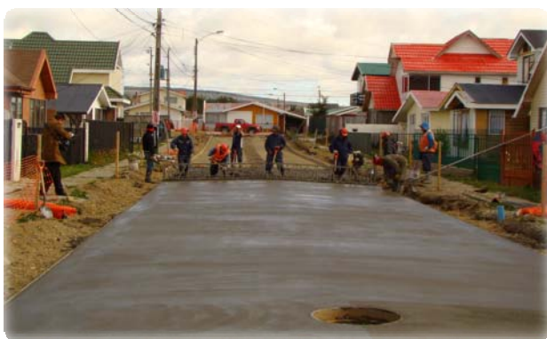
Pavimentos participativos, Punta Arenas

A lo largo de todo Chile, construimos barrios integrados y de calidad