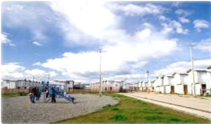
Población Los Castaños en Máfil, Los Ríos.

Las nuevas viviendas conformaron 750 barrios bien localizados.