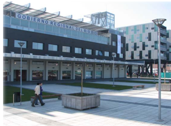
Plaza Bicentenario Concepción