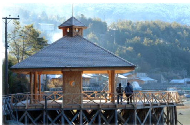
Plaza Techada Tortel