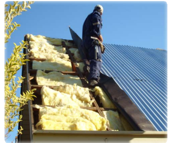
Aislación térmica Temuco