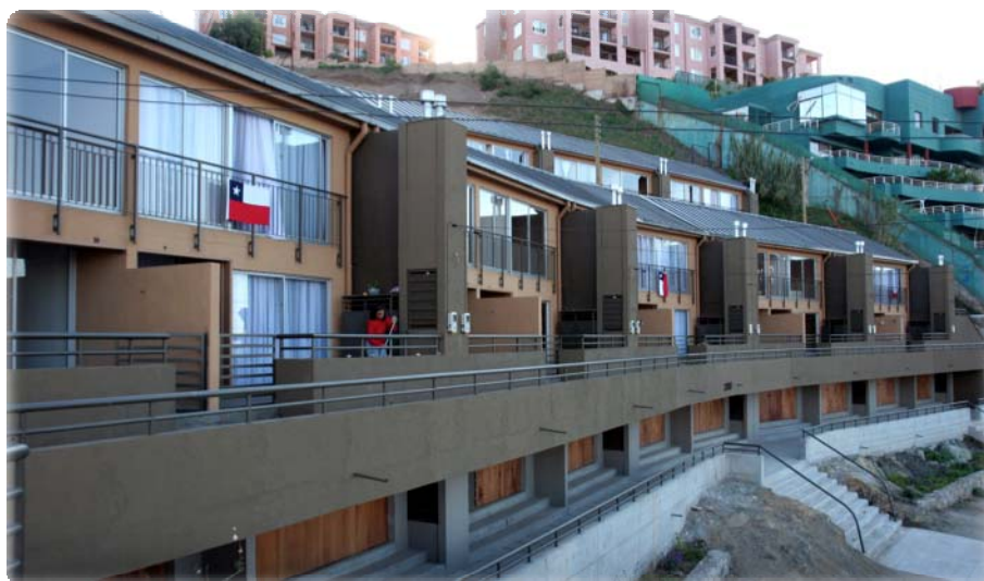
Condominio de pescadores en Concón