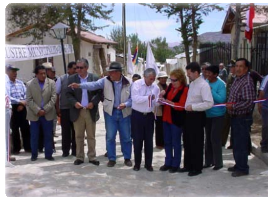
Pavimentos en Putre